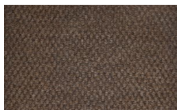
800 - Lever