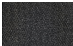
805 - Grey