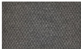
807 - Mist