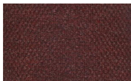
802 - Red