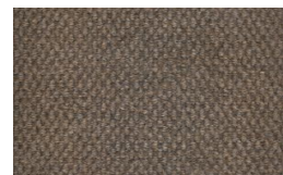
806 - Bege