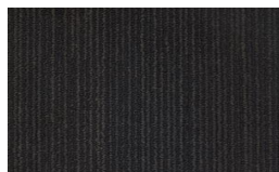
003 - Chumbo